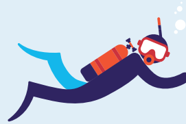
Travail en milieu hyperbare 60 interventions par an