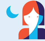
Travail de nuit 120 nuits par an

› A savoir : le dispositif entre en vigueur en 2015 pour ces 4 facteurs et en 2016 pour 6 autres.